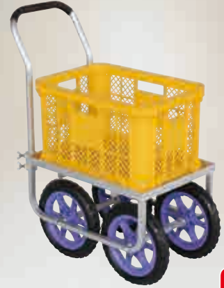
愛菜号 コンテナ1個用 12インチノーバンクタイヤ仕様