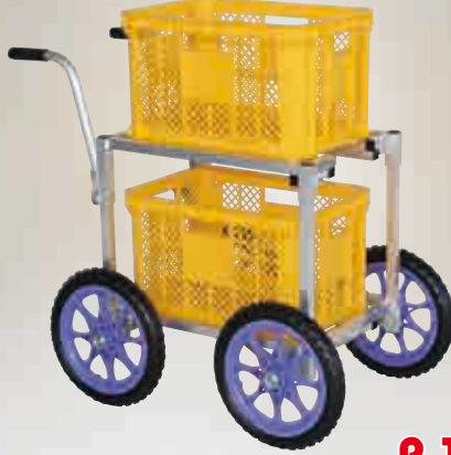
愛菜号 2段積・14インチタイヤタイプ