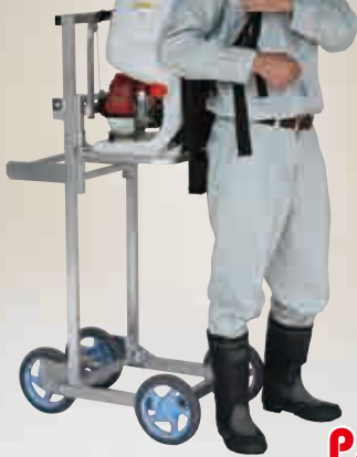
ショイツコ 移動式背負動噴背負台 (リフト式)