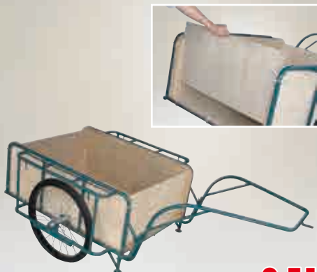
スチールリヤカー スチール製 リヤカー