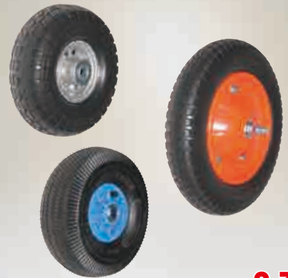
タイヤセット 3.50-4シリーズ 13×3シリーズ