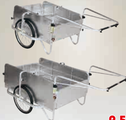
コンパック アルミ製 全面アルミパネル付タイプ