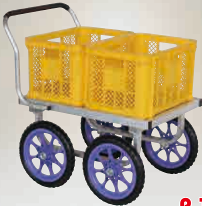
愛菜号 荷台面平形4輪車タイプ