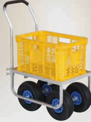
愛菜号 コンテナ1個用 大きいタイヤ仕様