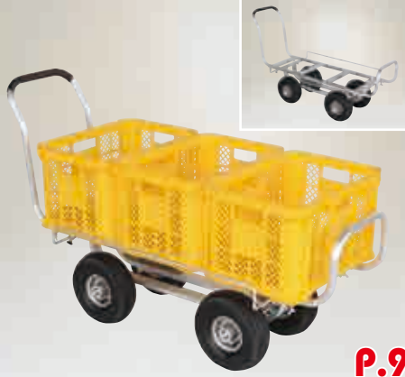
愛菜号 アルミ製 ハウスカー (タイヤ幅調節タイプ)