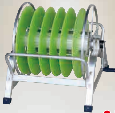
灌太郎 灌水チューブ・灌水ホース 点滴チューブ・散水ホース 巻取器