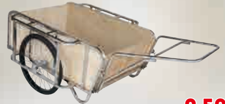
輪太郎 ステンレス製 大型リヤカー