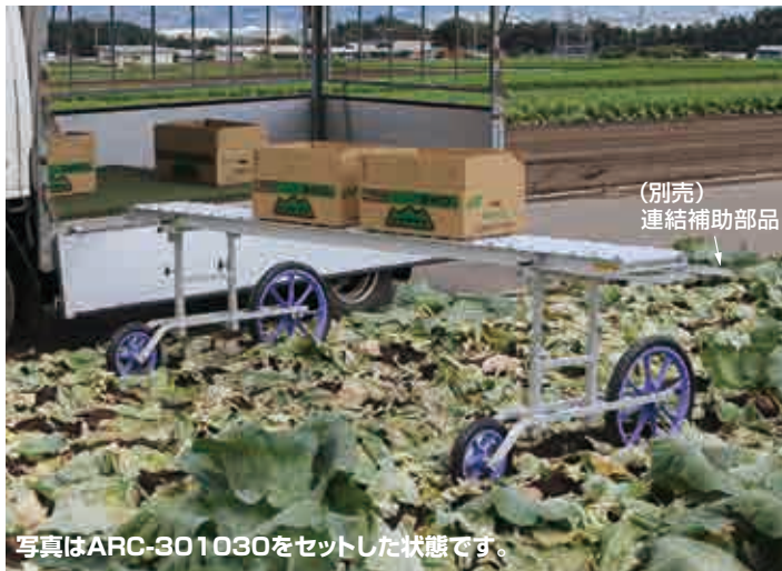
写真はARC-301030をセットした状態です。