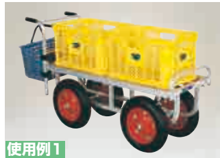
使用例1 20kgコンテナ2個縦置 (ガードを取りはずした状態)