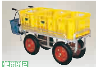
使用例2 20kgコンテナ3個横置