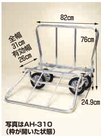
写真はAH-310 (枠が開いた状態)