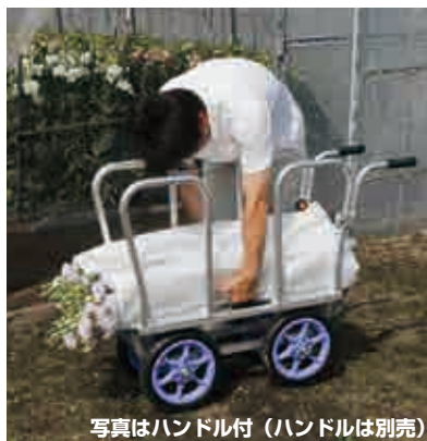
写真はハンドル付 (ハンドルは別売)