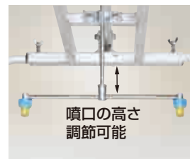
噴口の高さ調節可能

噴口は、人力除草用を使用 (カバー幅60~90cmに対応) 動力で使用の場合は、低圧で使用してください。