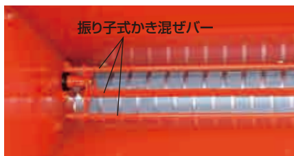
振り子式かき混ぜバー