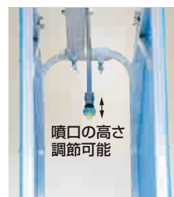
噴口の高さ調節可能

噴口は、人力除草用を使用 (カバー幅25~60cmに対応) 動力で使用の場合は、低圧で使用してください。