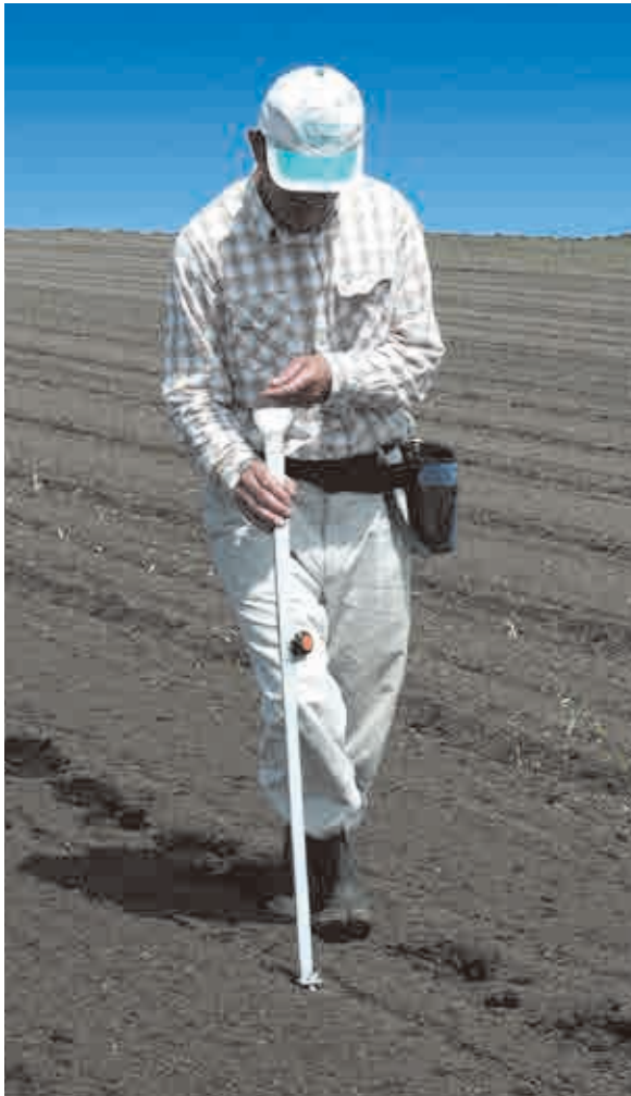
写真はイラスト①の状態