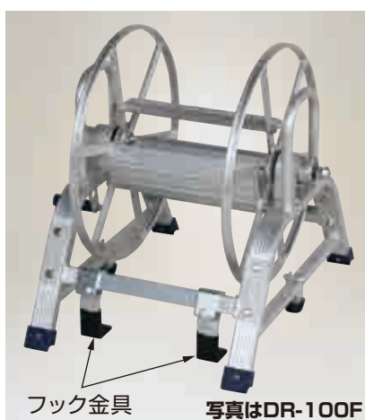
フック金具 写真はDR-100F

DR-150F φ8.5mmホース150m巻用 ※フック有効幅3.5cm (φ8.5より戻し金具付) 重量 6.8kg 本体価格 19,800円 (税別)