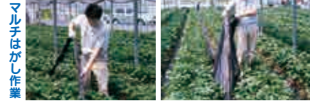
マルチはがし作業

●歩行速度で連続的にマルチにスリットを入れることができ、スリットにより、いちごを引き出す作業が楽におこなえ、またスリットがミシン目状に入っていますので、マルチはがし作業も楽におこなえます。