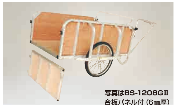
写真はBS-1208GI 合板パネル付 (6mm厚)