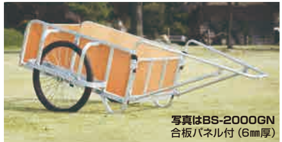
写真はBS-2000GN 合板パネル付 (6mm厚)