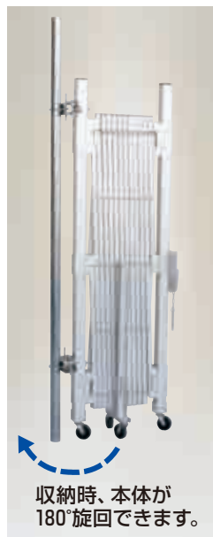
収納時、本体が180°旋回できます。