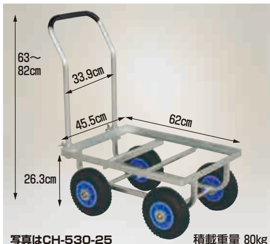
写真はCH-530-25 積載重量 80kg

CH-530-25 エアータイヤ (TR-2.50×4T) 重量 7.7kg 本体価格 21,000円 (税別)