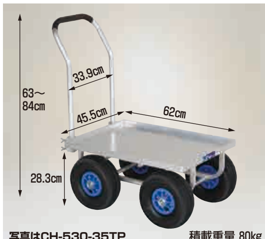
写真はCH-530-35TP 積載重量 80kg

CH-530-35N ノーパンクタイヤ (TR-3.50×4N) 重量 9.7kg 本体価格 26,000円 (税別)