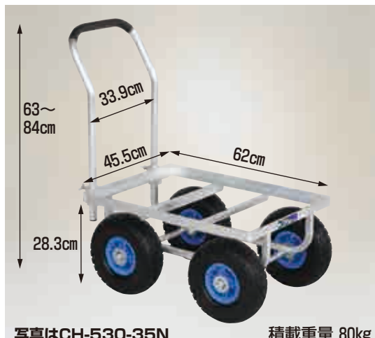
写真はCH-530-35N 積載重量 80kg

CH-530-35T エアータイヤ (TR-3.50×4T) 重量 9.7kg 本体価格 24,000円 (税別)