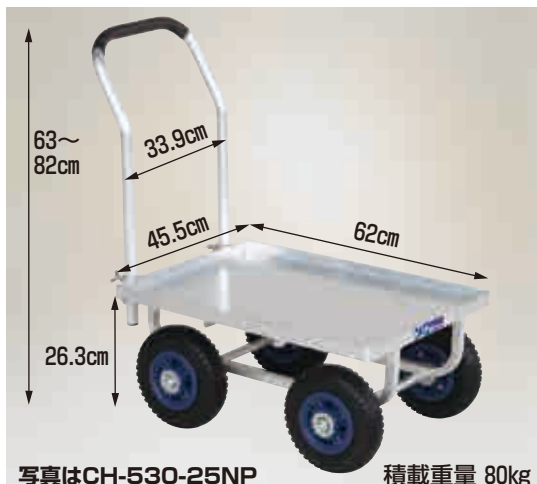
写真はCH-530-25NP 積載重量 80kg

CH-530-25N ノーパンクタイヤ (TR-2.50×4N) 重量 7.7kg 本体価格 23,000円 (税別)