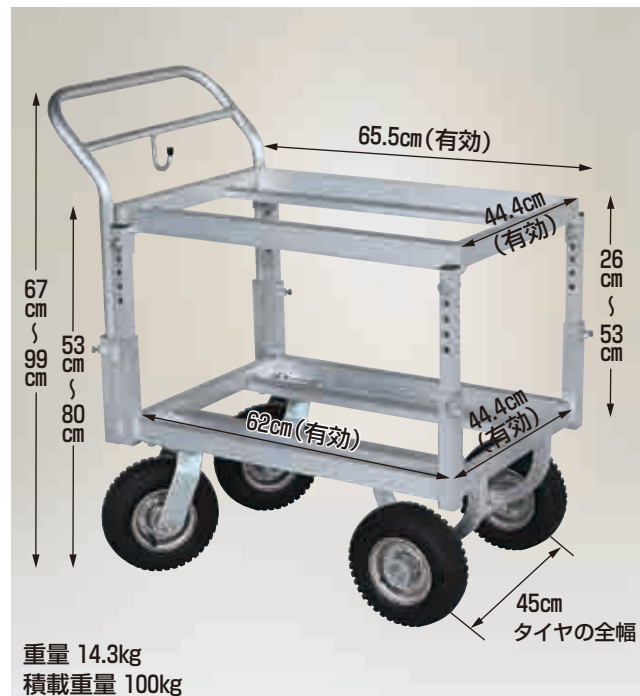
重量 14.3kg 積載重量 100kg