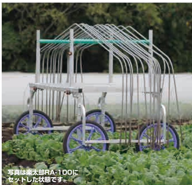
写真は楽太郎RA-100にセットした状態です。