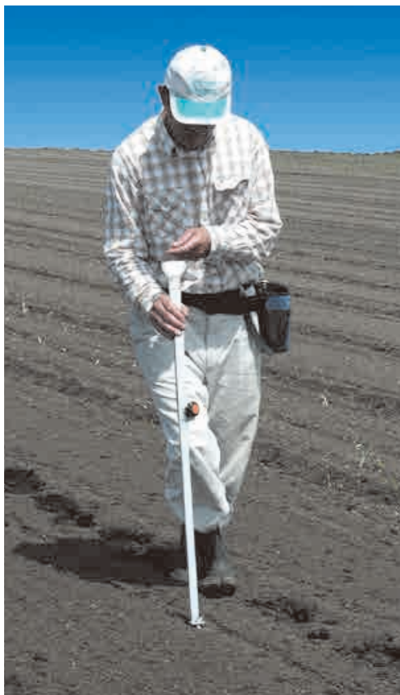
写真はイラスト①の状態