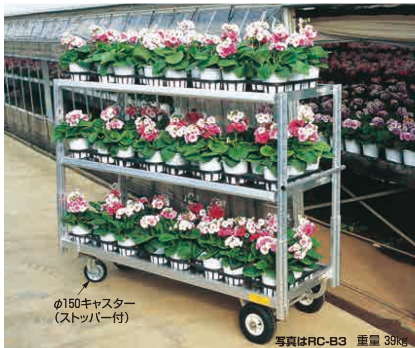
φ150キャスター (ストッパー付)