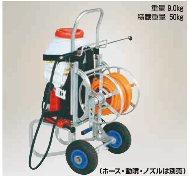
(ホース・動噴・ノズルは別売)