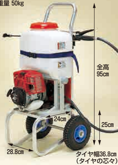
写真はDC-100A (動噴は別売)