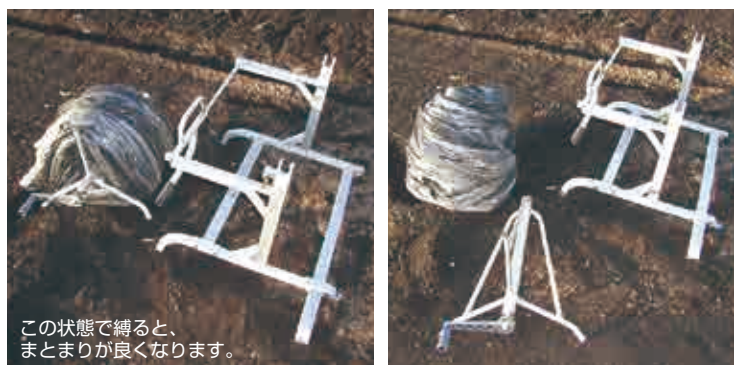
この状態で縛ると、まとまりが良くなります。