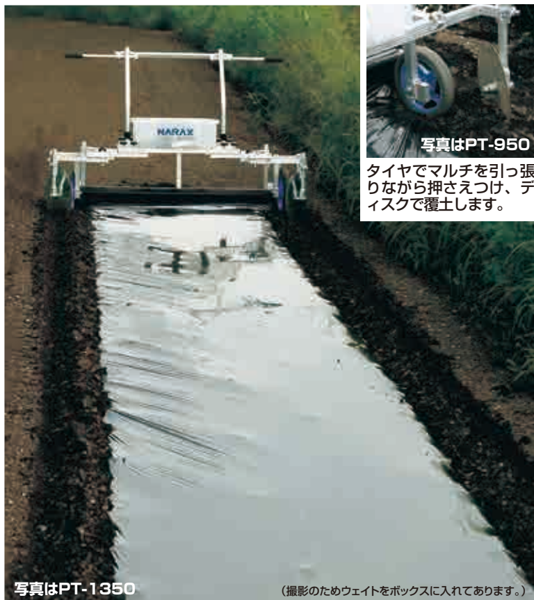
写真はPT-950 タイヤでマルチを引っ張りながら押さえつけ、ディスクで覆土します。