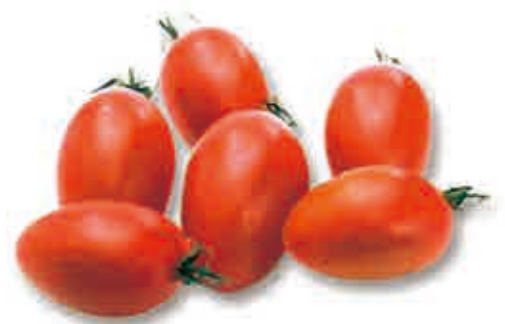
プラム型ミニトマト