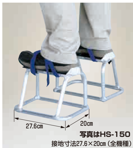
写真はHS-150 接地寸法27.6×20cm(全機種)