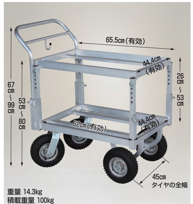
重量 14.3kg 積載重量 100kg