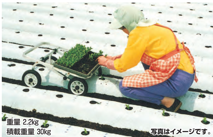
重量 2.2kg 積載重量 30kg