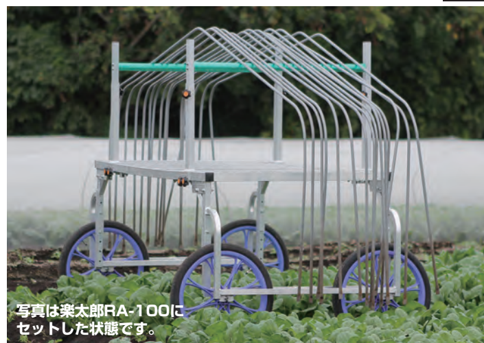
写真は楽太郎RA-100にセットした状態です。