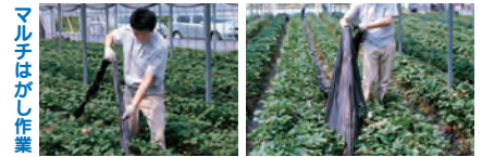
マルチはがし作業

●歩行速度で連続的にマルチにスリットを入れることができ、スリットにより、いちごを引き出す作業が楽におこなえ、またスリットがミシン目状に入っていますので、マルチはがし作業も楽におこなえます。