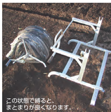
この状態で縛ると、まとまりが良くなります。