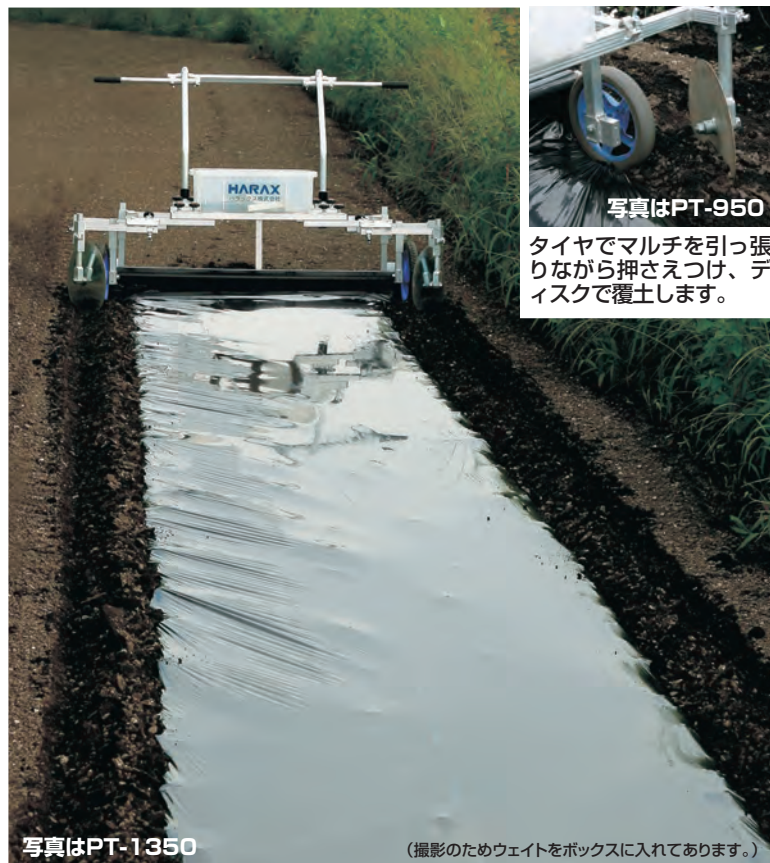
写真はPT-950 タイヤでマルチを引っ張りながら押さえつけ、ディスクで覆土します。