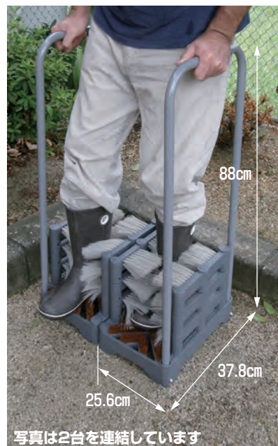
写真は2台を連結しています