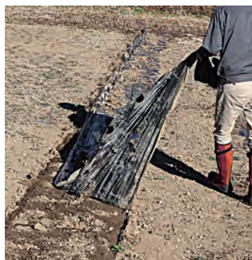
チョイハギで片側を剥ぎ取った後のマルチの回収作業。