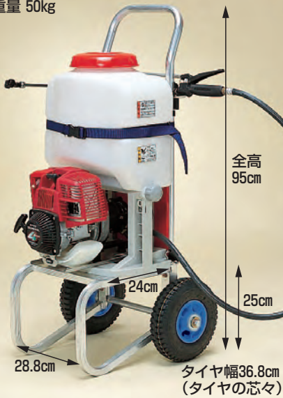
写真はDC-100A (動噴は別売)