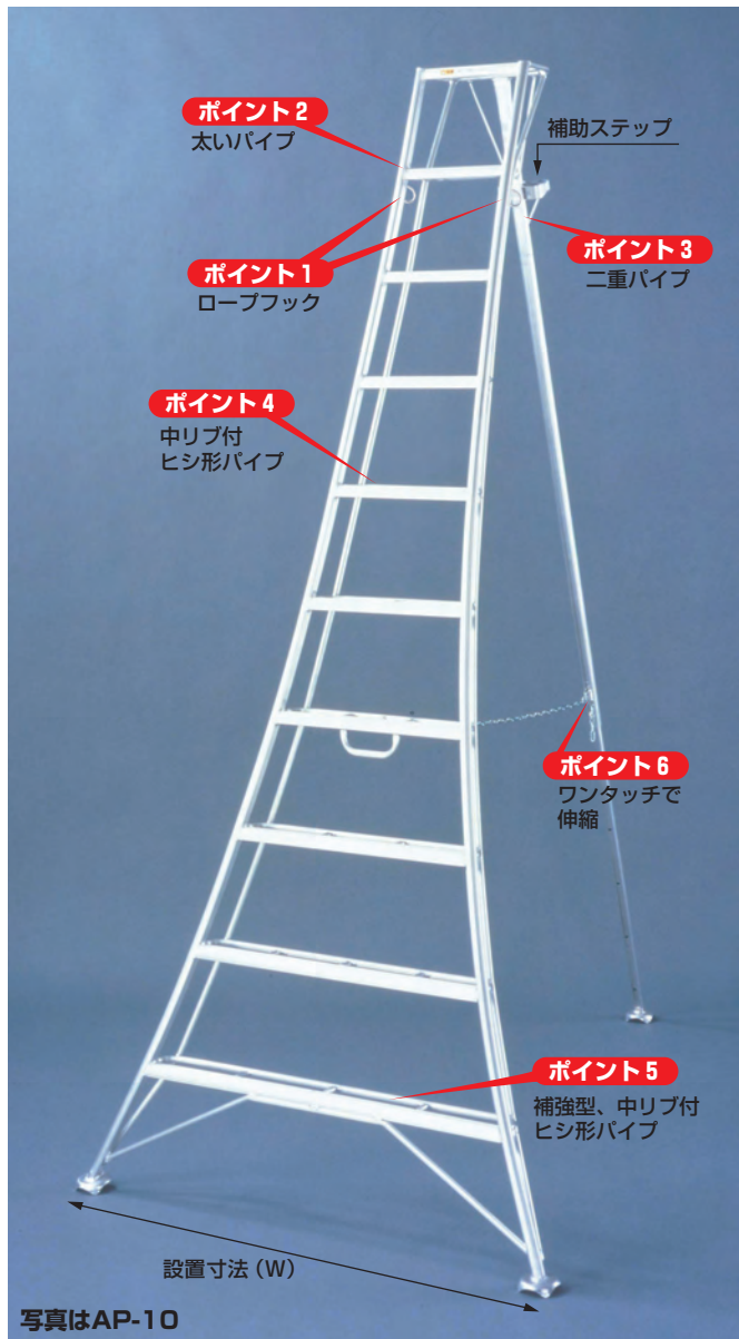
写真はAP-10 アルステップの全高は実際にご使用になる70°に開いた状態の高さで表示してあります。全長は全高×1.06でおおよそ算出できます。