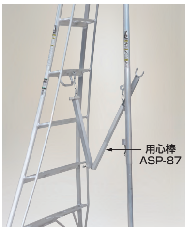
写真はAP-8の折りたたみ途中 (アルステップは別売)