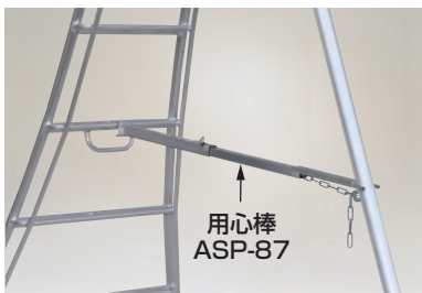
写真はAP-8の使用時 (アルステップは別売)