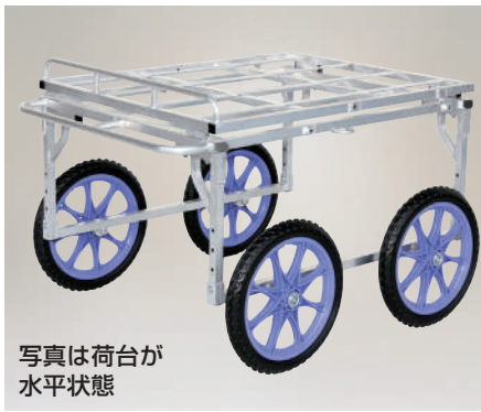
写真は荷台が水平状態