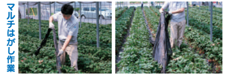
マルチはがし作業

●歩行速度で連続的にマルチにスリットを入れることができ、スリットにより、いちごを引き出す作業が楽におこなえ、またスリットがミシン目状に入っていますので、マルチはがし作業も楽におこなえます。