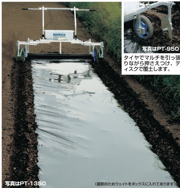
写真はPT-950 タイヤでマルチを引っ張りながら押さえつけ、ディスクで覆土します。