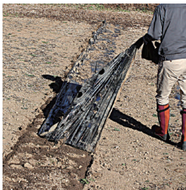
チョイハギで片側を剥ぎ取った後のマルチの回収作業。