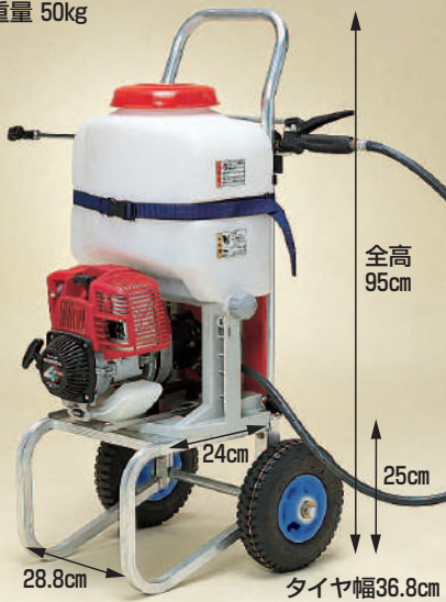
写真はDC-100A (動噴は別売)