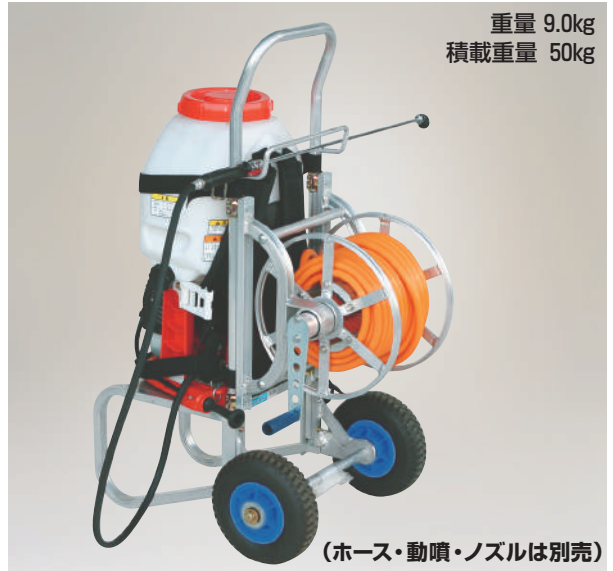
(ホース・動噴・ノズルは別売)