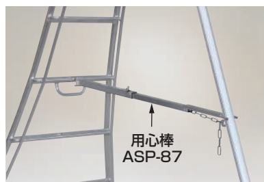
写真はAP-8の使用時 (アルステップは別売)