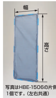
写真はHBE-1506の片側1個です。(左右共通)

HBE-1806 本体価格 22,000円 (税別) (HBE-1827K用) (2個セットの価格です。)