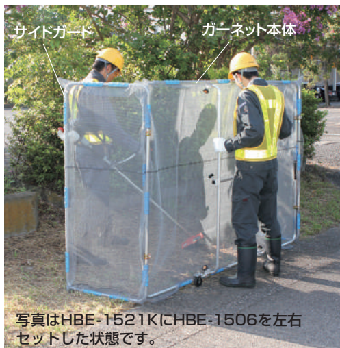
写真はHBE-1521KにHBE-1506を左右セットした状態です。