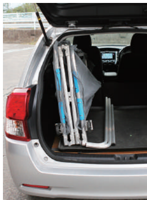
写真はステーションワゴン車に積んだ状態