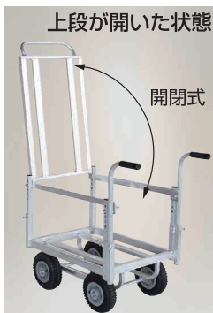
上段が開いた状態