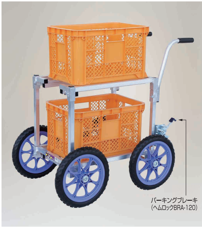
パーキングブレーキ (ヘムロックBRA-120)