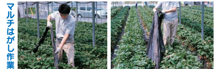
マルチはがし作業

●歩行速度で連続的にマルチにスリットを入れることができ、スリットにより、いちごを引き出す作業が楽におこなえ、またスリットがミシン目状に入っていますので、マルチはがし作業も楽におこなえます。