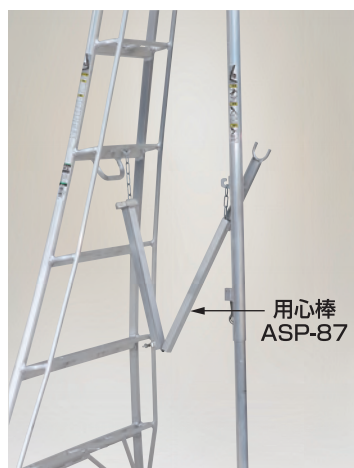
写真はAP-8の折りたたみ途中(アルステップは別売)