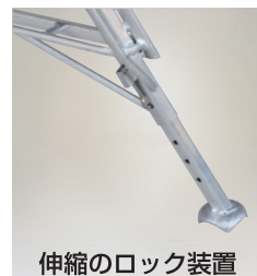
伸縮のロック装置