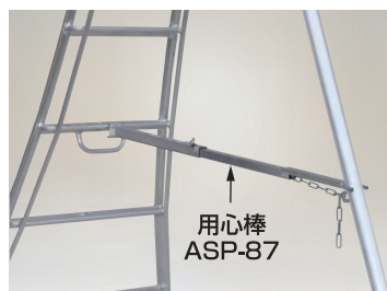
写真はAP-8の使用時(アルステップは別売)