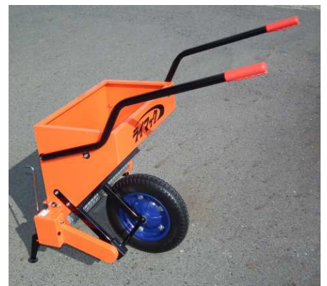
ハンドルを逆向きに付けた状態