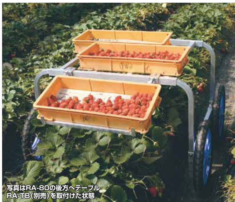
写真はRA-80の後方へテーブルRA-TB(別売)を取付けた状態