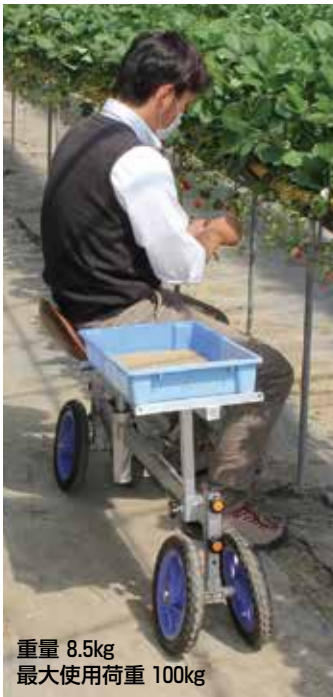
重量 8.5kg 最大使用荷重 100kg