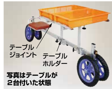
写真はテーブルが2台付いた状態

●ラクエモンに追加のテーブルを取付ければ作業効率が上がります。 ※取付け可能機種 RS-700S・800K RS-TT 追加テーブル (テーブルホルダー・ジョイント付) 定価 17,600円 (税抜 16,000円) (送料 別途)