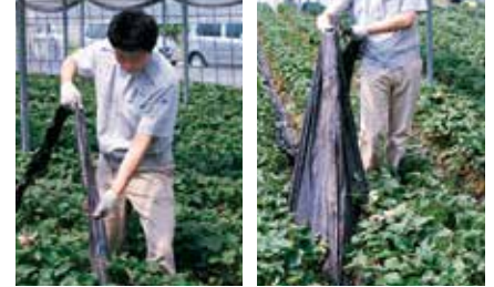
マルチはがし作業