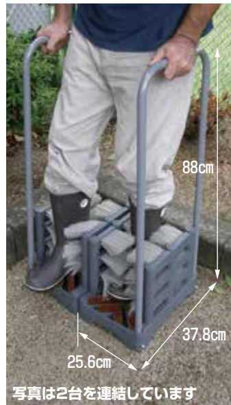
写真は2台を連結しています