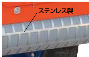
回転式散布量調節ロール (ステンレスの四角い溝付)