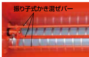
振り子式かき混ぜバー (ホッパー内部)