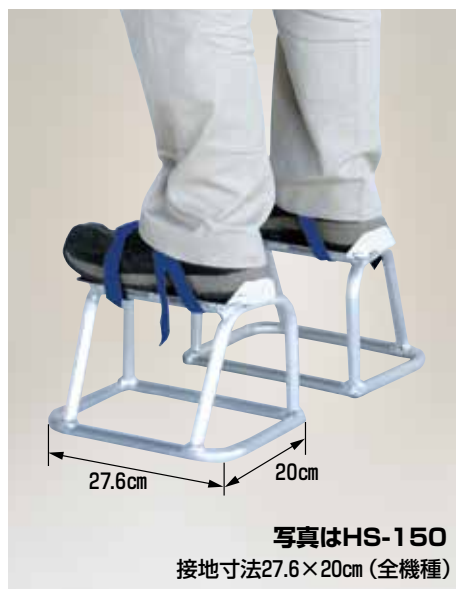
写真はHS-150 接地寸法27.6×20cm(全機種)