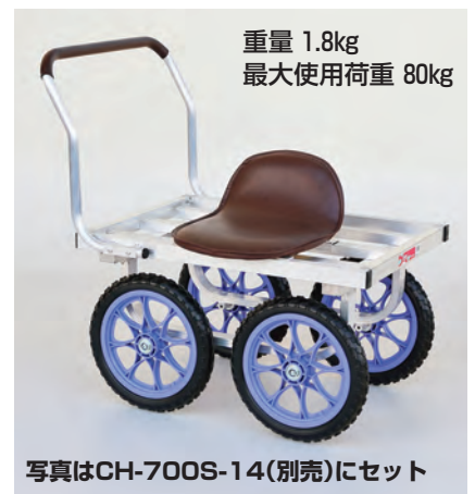
写真はCH-700S-14(別売)にセット