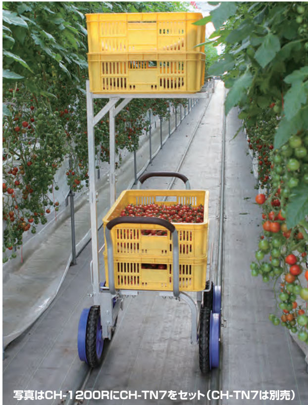
写真はCH-1200RにCH-TN7をセット(CH-TN7は別売)