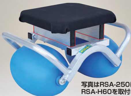
写真はRSA-250にRSA-H60を取付けた状態です。