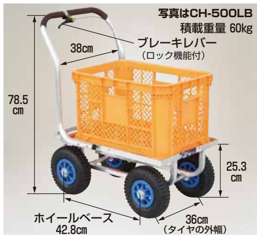
写真はCH-500LB 積載重量 60kg