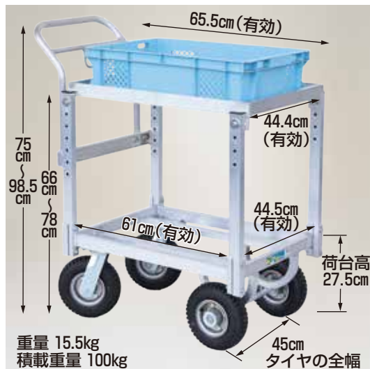
重量 15.5kg 積載重量 100kg

注) ロック機能付きブレーキは簡易的な機構のため、坂道での放置は危険ですからおやめください。またタイヤの空気が抜けた状態や濡れた状態などでは性能が低下します。ご注意ください。また減速時にはタイヤとブレーキシューとの摩擦によりお互いがすり減ります。予めご了承ください。