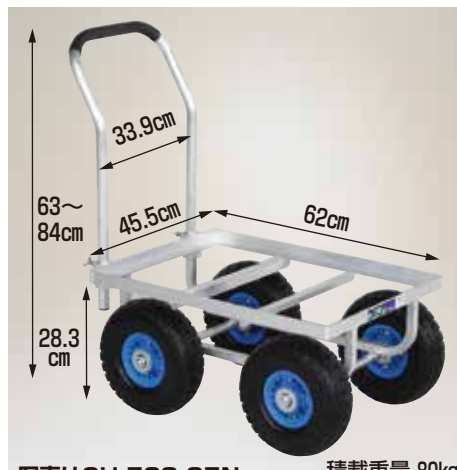
写真はCH-530-35N 積載重量 80kg

CH-530-35T エアータイヤ (TR-3.50×4T) 重量 9.7kg 定価 39,710円 (税抜 36,100円)