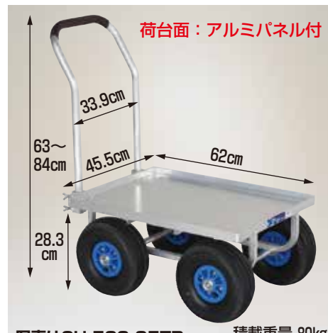
写真はCH-530-35TP 積載重量 80kg

CH-530-35TP エアータイヤ (TR-3.50×4T) 重量 11kg 定価 47,630円 (税抜 43,300円)