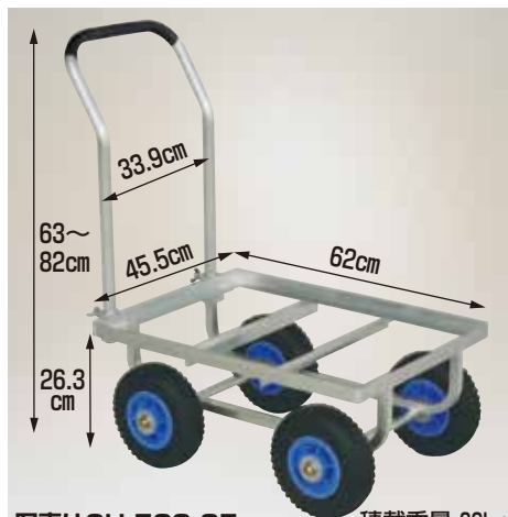
写真はCH-530-25 積載重量 80kg

CH-530-25 エアータイヤ (TR-2.50×4T) 重量 7.7kg 定価 34,870円 (税抜 31,700円)