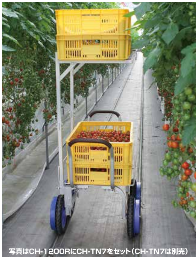
写真はCH-1200RにCH-TN7をセット（CH-TN7は別売）