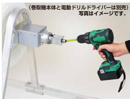
(巻取機本体と電動ドリルドライバーは別売) 写真はイメージです。