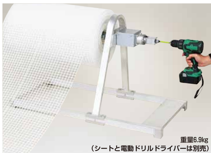
重量6.9kg (シートと電動ドリルドライバーは別売)