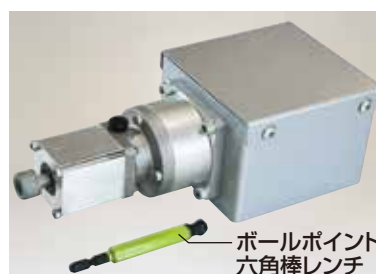
EAT-20 重量2.3kg (ボールポイント六角棒レンチ付) 定価 121,000円 (税抜 110,000円)