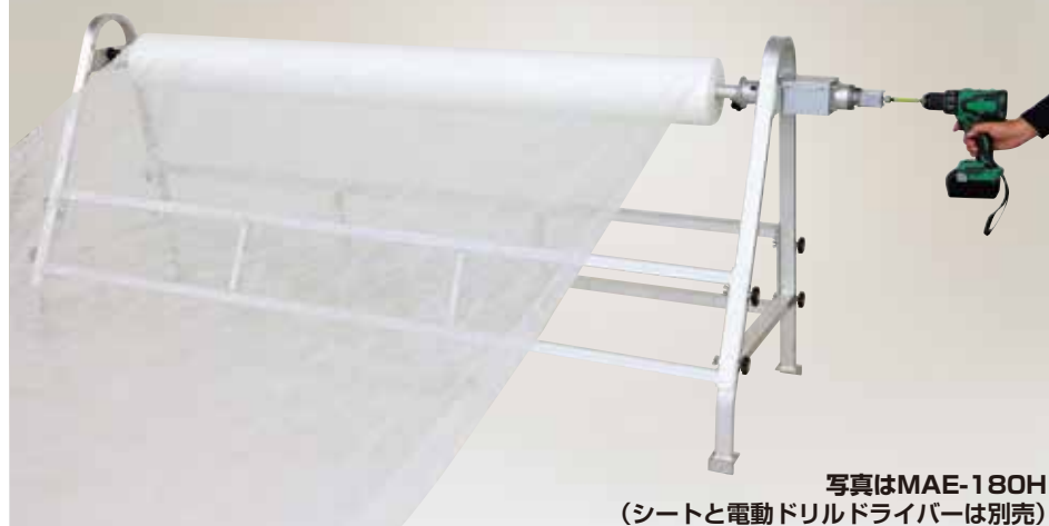
写真はMAE-180H (シートと電動ドリルドライバーは別売)

注) マキエースをMA型で購入の場合EAT-20の取付用の穴は空いていません。 またMAE型をご購入の場合はハンドル及びラチェットは付属しません。