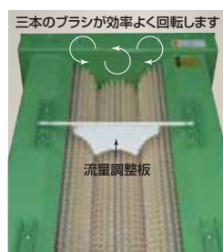
ポリッシャー(磨き機)