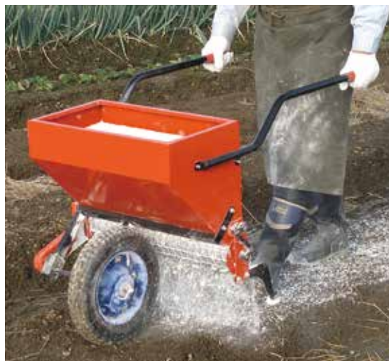
回転式散布量調節ロール (ステンレスの四角い溝付)