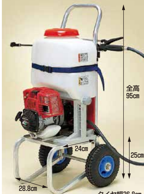
写真はDC-100A (動噴は別売)